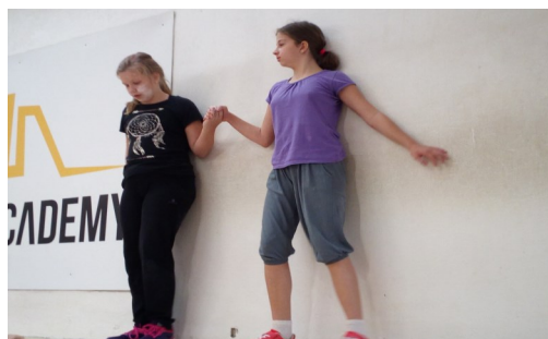
Žáci sedmého ročníku na parkouru.