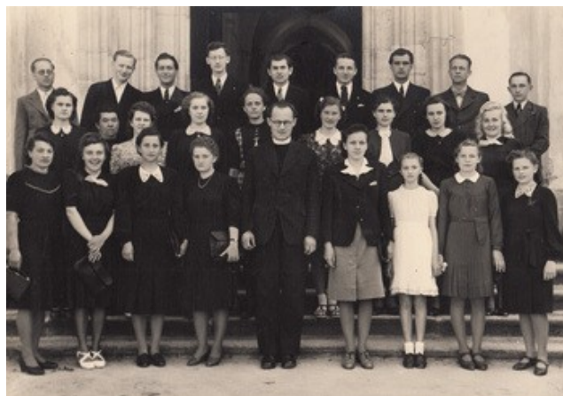
Na gymnázium v roce 1941 - druhá řada, 4. zprava.