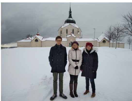
Poutní místo Zelená hora ve Žďáru nad Sázavou