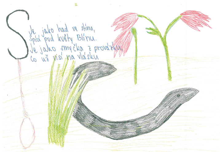
autor: Vendula Pšenčíková

sloku o čtyřech verších. Básně jsme zpracovávali na počítačích, a poté jsme je nechali vytisknout. Na výtvarné výchově jsme je dostali jako zadání pro výtvarné zpracování textu. Tento výtvar je vypracovali na čtvrtku formátu A4. Zvolené písmeno jsme ztvárnili výtvarně a zároveň tak, aby v sobě odráželo text básně. Žáci to pojali různými styly, ale všechny byly barevné a zajímavé. Většina výtvarů byla promyšlená, ale některé byly odbyté. Všechny výtvary jsou vyvěšeny na nástěnce před třídou 206. Projekt byl zajímavý a všichni si ho užili.