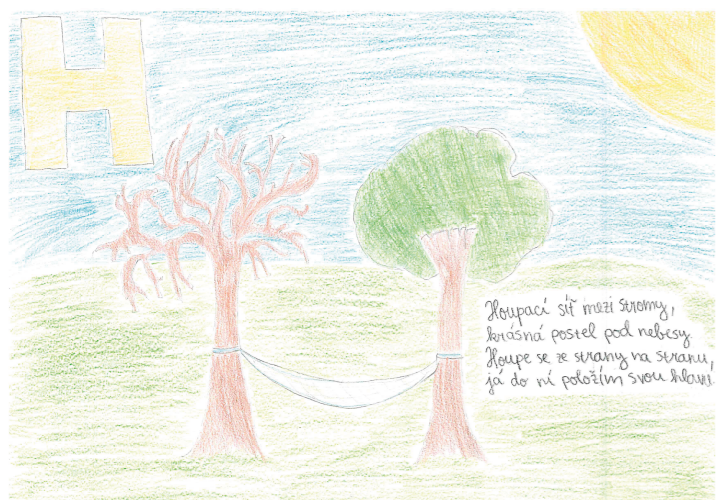
autor: Tereze Bauerová, 9. B