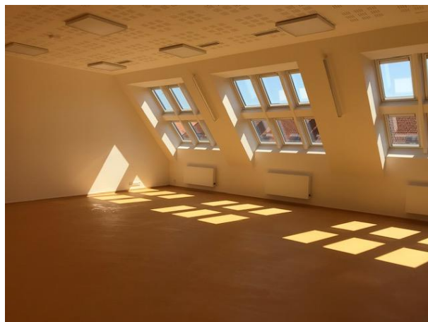
jedna z kmenových učeben