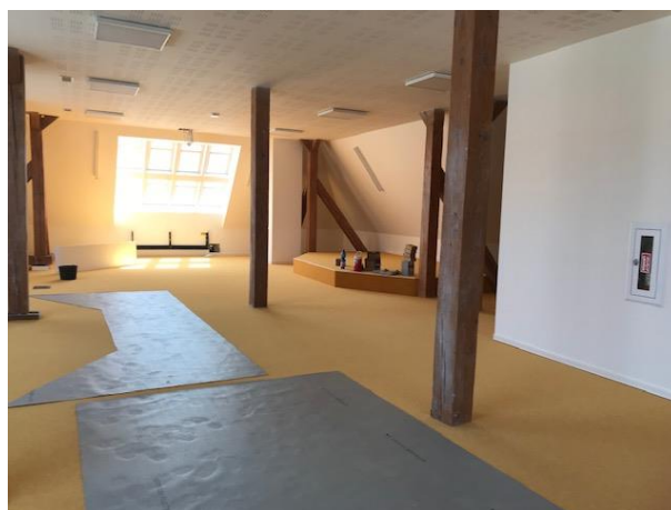
hudebně-dramatický sál s knihovnou