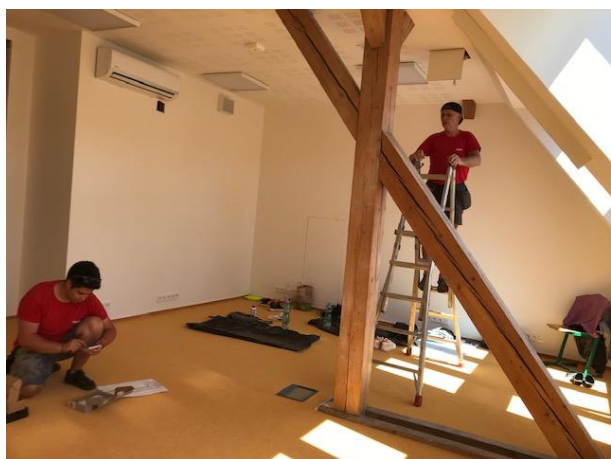
příprava počítačové učebny