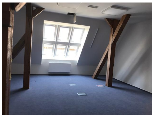
jeden z budoucích kabinetů pedagogů