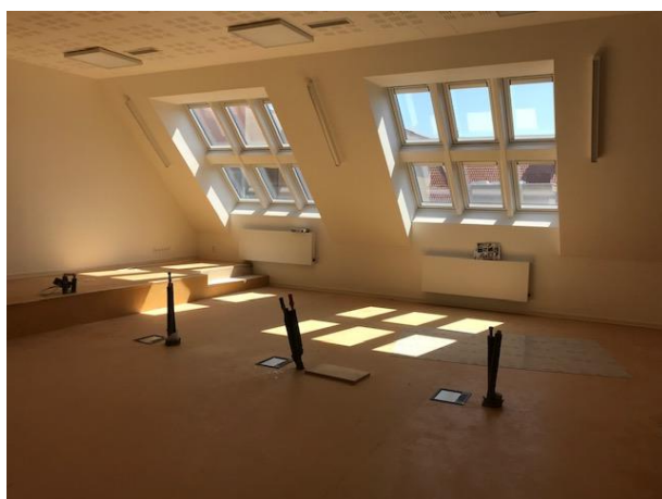
příprava na přírodovědnou laboratoř