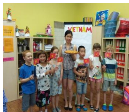
Spolupráce s rodiči

Žáci základní školy se v tomto školním roce mohou těšit na jednodenní ročníkový projektový den zaměřený na poznávání zemí a kultur, jejichž jazyky škola vyučuje a také na multikulturní hudební den.