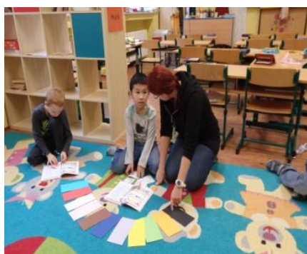
Práce školních asistentek

Žáci a děti s odlišným mateřským jazykem budou prostřednictvím zajímavých aktivit seznamováni s českou kulturou, našimi zvyky a vedeni k úctě k našim tradicím. Součástí jejich integrace do kolektivu spolužáků bude i poznávání kultury, zvyků a jazyka zemí, odkud děti pocházejí, kdy za pomoci školních asistentek budou pro své české spolužáky ve třídě připravovat různé činnostní aktivity či prezentace o zemích nebo v rámci projektových dnů pro ostatní děti ve škole.