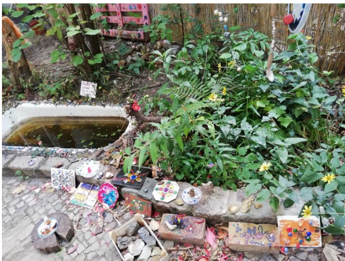
Malý výtvarný ateliér na dvorku, přístupný dětem o jakémkoliv přestávce.

Podnětů bylo spousta i k diskusi se zástupci dalších základních škol z ostatních krajů ČR. Těšilo nás nasbírat nové nápady, vidět, jak funguje školství jinde, diskutovat nad náměty a uvědomit si, že za tím, aby škola byla útulná, přívětivá a bezpečná pro děti, aby měly chuť se v ní každý den naučit něco nového, stojí největší měrou každodenní pečlivá práce všech zaměstnanců školy, kteří se snaží ve škole být kvůli dětem a pro děti.