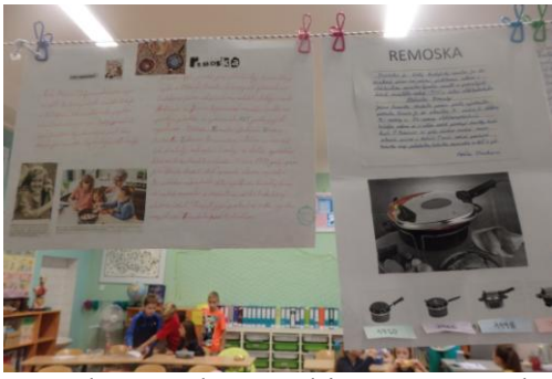
Slavné české vynálezy a objevy nám představila třída 4. C – např. remosku