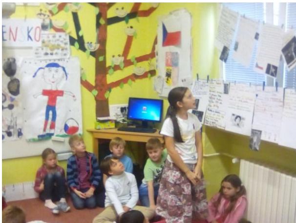
Třída 3. B představila významné československé sportovce