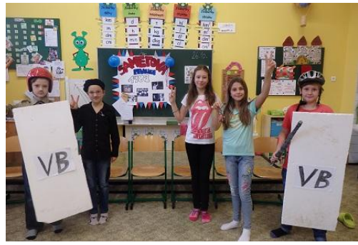
Roku 1989 a sametové revoluci se věnovali žáci 5. A