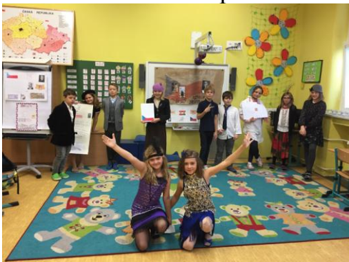
Třída 4. A dramaticky ztvárnila rok 1918