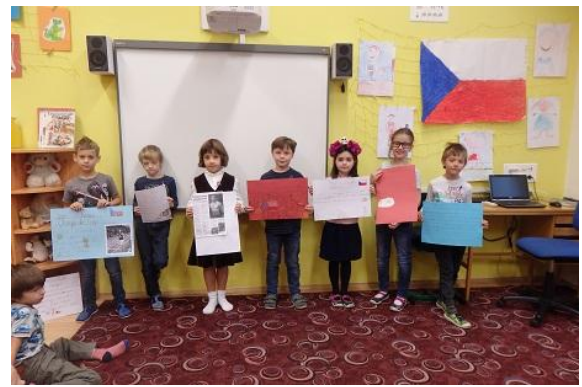
Třída 2. B prezentovala největší sportovní úspěchy české historie