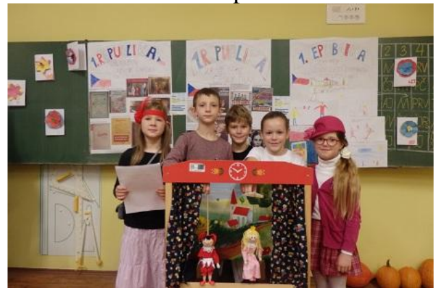
Třída 3. C dramatizací nastínila kulturu 1. republiky (loutkové divadlo, film, ...)