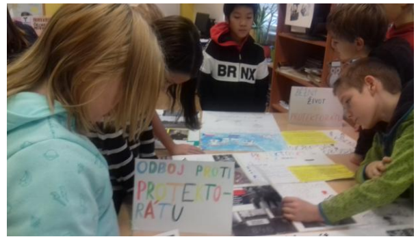
Třída 5. C se zabývala protektorátem Čechy a Morava

A na závěr dopis jednoho z našich žáků naší stoleté dámě: