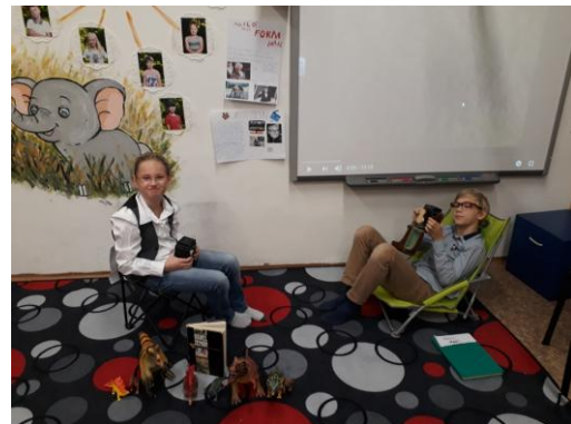
Třída 4. B se zaměřila na významné české osobnosti – zde režiséři Karel Zeman a Miloš Forman