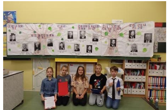
Třída 3. A zpracovala informaci o všech našich prezidentech