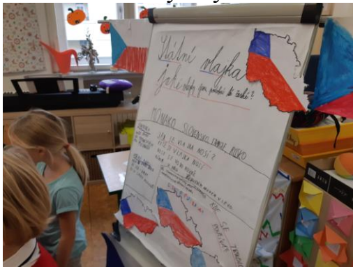
S českými symboly nás seznámila třída 2. C