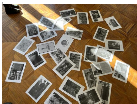
3. Výukové materiály do výuky dějepisu