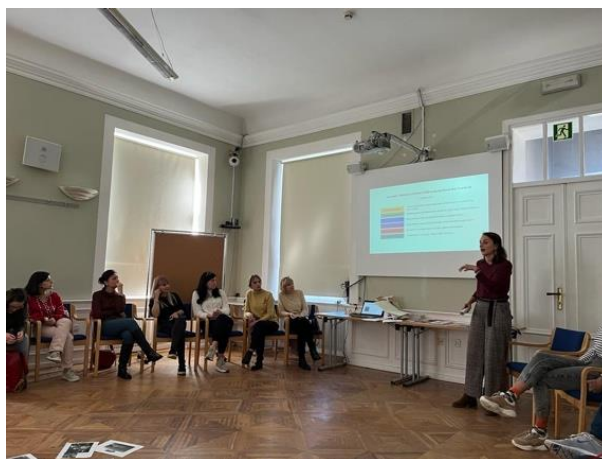
2. Seminář o tématu „Uprooted children“ a následný workshop