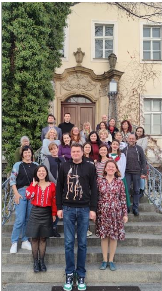
1. Účastníci mezinárodního workshopu z České republiky, Německa, Polska a Ukrajiny

Více informací o tématu můžete nalézt na stránkách Škol Paměti národa na tomto odkazu: Uprooted children, https://skoly.pametnaroda.cz/vyukove-materialy/